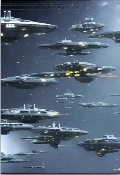
Ongeïdentificeerde luchtverschijnselen (UAP's)

Jouw energetische signatuur verankert de fysieke manifestaties van jouw doel en missie, en verspreidt zich in het collectieve bewustzijn, waar het de realiteit vormgeeft.